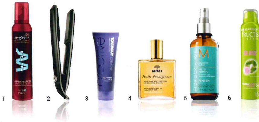
1 „PRO SERIES SCHAUMFESTIGER MAX HOLD“ VON WELLA, UM 4 €. 2 „ECLYPSE STYLER“ VON GHD, UM 245 €. 3 „TEXTURING GLUE“ VON TONI & GUY, UM 10 €. 4 „HUILE PRODIGIEUSE“ HAAR- UND KÖRPERÖL VON NUXE, UM 26 €. 5 „GLIMMER SHINE SPRAY“ VON MOROCCANOIL, UM 45 €. 6 „FRUCTIS GLANZ-HAARSPRAY“ VON GARNIER, UM 2 €.

Sina Velkes Styling-Tipp: Für den Sleek-Look wird Schaumfestiger, ein Fön, ein Glätteisen, ein Stielkamm und für das Finish Gel für die Ansätze und Haaröl für die Längen und Spitzen benötigt. In das feuchte Haar am Ansatz Schaumfestiger einarbeiten. Einen Scheitel ziehen und mit dem Stielkamm das Haar nach hinten kämmen, ohne den Scheitel dabei zu verlieren. Das Haar im Anschluss trocknen, dabei kann es sich bereits in die richtige Richtung legen. Mit dem Gel das Haar am Ende fixieren. Durch das Haaröl bekommen die Längen und Spitzen ein glänzendes Finish.