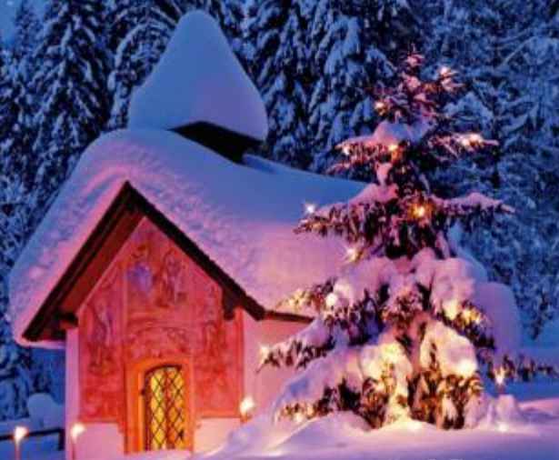
Kapelle Eimau, Oberbayern

Heute klicken, morgen da Geschenke unter 100 Euro