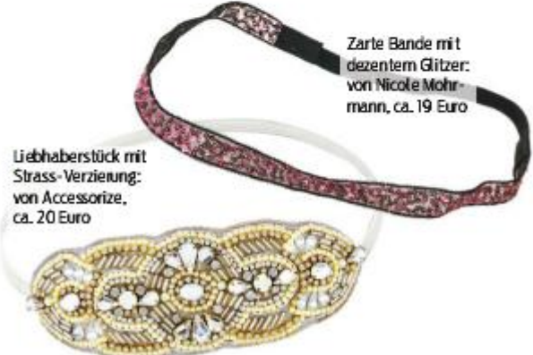
Liebhäberstück mit Strass-Verzierung: von Accessorize, ca. 20 Euro