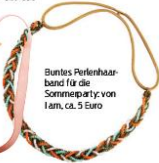
Buntes Perlenhaarband für die Sommerparty: von Iarn, ca. 5 Euro