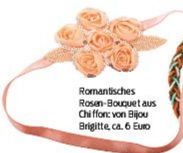
Romantisches Rosen-Bouquet aus Chi ffon: von Bijou Brigitte, ca. 6 Euro