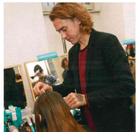
© Blugirl Autumn / Winter 2014 Collection, FRISUR: James Pecis für Moroccanoil

oder Just Cavalli ihr Können unter Beweis zu stellen. Die Ergebnisse konnten sich durchweg sehen lassen: Undone-Looks, raffinierte Hochsteckkreationen, rockige 60ies Stylings, sleeke und futuristische Frisuren und vieles mehr zierten die Modelhäupter.