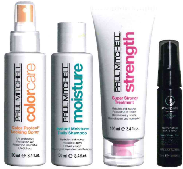
15 Ob Kurztrip oder Familienurlaub – keine Reise ohne Koffer packen. Damit die Beautyprodukte nicht zu Hause bleiben müssen, gibt es die praktischen Reisegrößen von Paul Mitchell®. Mit dem Color Protect® Locking Spray , Instant Moisture® Daily Shampoo und dem Super Strong® Treatment können Sie ihr Haar auch im Urlaub mit der nötigen Pflege versorgen. www.paul-mitchell.de