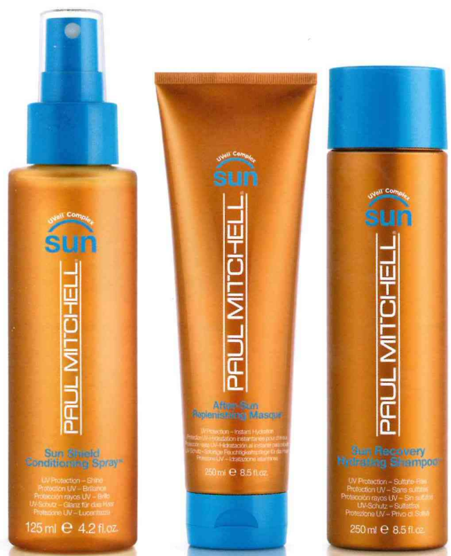
14 Gerade im Urlaub sind die Haare oft besonderen Strapazen ausgesetzt. Sonne, Wind und Salzwasser können das Haar austrocknen. Farbe und Glanz verschwinden. Davor schützen die drei Strandbegleiter von Paul Mitchell® Sun: Das Sun Recovery Hydrating Shampoo ®, das Sun Shield Conditioning Spray ®, und die After-Sun Replenishing Masque ®. www.paul-mitchell.de