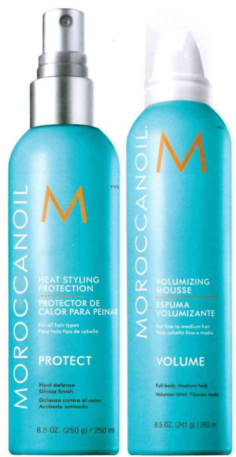
15 MOROCCANOIL® erweitert seine Haarpflegelinie um zwei neue Produkte: MOROCCANOIL® Heat Styling Protection – wirksamer Schutz gegen heiße Föhnluft, Hitzeschäden durch Glätteisen, Lockenstab und Lockenwickler und MOROCCANOIL® Volumizing Mousse – Volumen für feines Haar, Griffigkeit für jede Frisur. www.moroccanoil.de