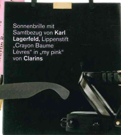
Sonnenbrille mit Samtbezug von Karl Lagerfeld , Lippenstift „Crayon Baume Lèvres“ in „my pink“ von Clarins