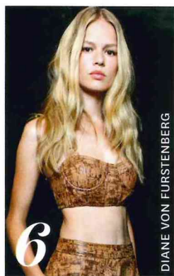
DIANE VON FURSTENBERG